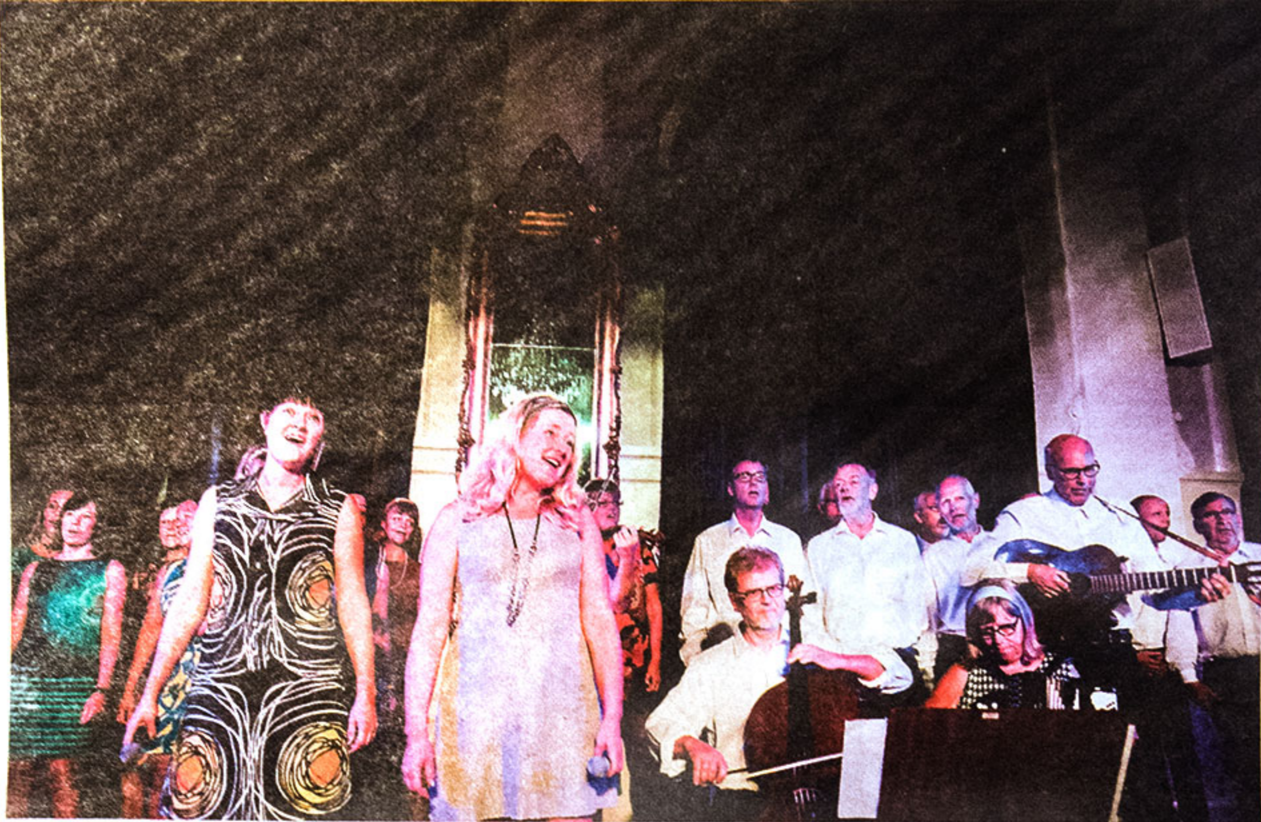
Det blev stående ovationer när den sångglada Månkören försökt att fatta livet på sin kalaskonsert i Stadshotellets festsal.