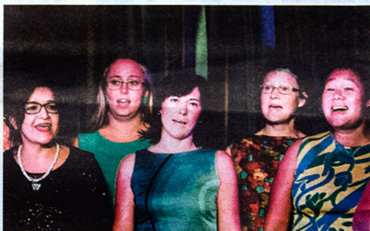
Färgglada sångfåglar i Månkören.